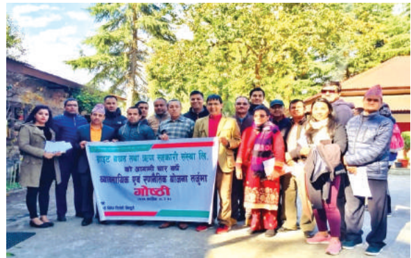
सवाङ्गीण समृद्धिका लागि सहकार्य