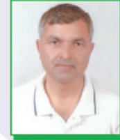
हरिबोल बडाल सदस्य