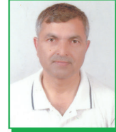
हरिबोल बडाल सदस्य